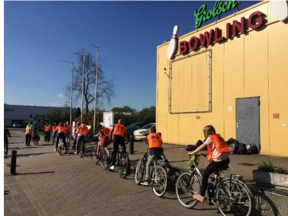
Praktisch verkeersexamen 23 april