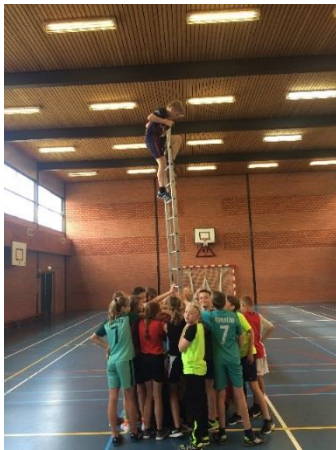
Samenwerking bij gymnastiek